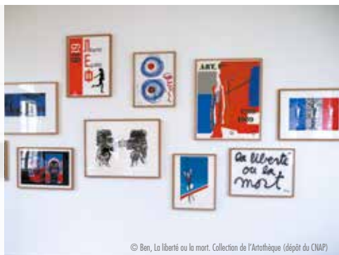
© Ben, La liberté ou la mort. Collection de l'Artothèque (dépot du CMAP)