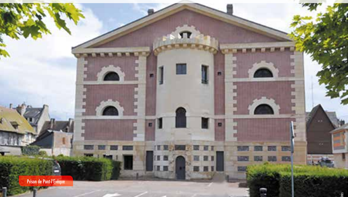
Prison de Pont-l'Évêque

Centre Hospitalier, Pont-l'Évêque • Espace culturel les Dominicaines, Pont-l'Évêque