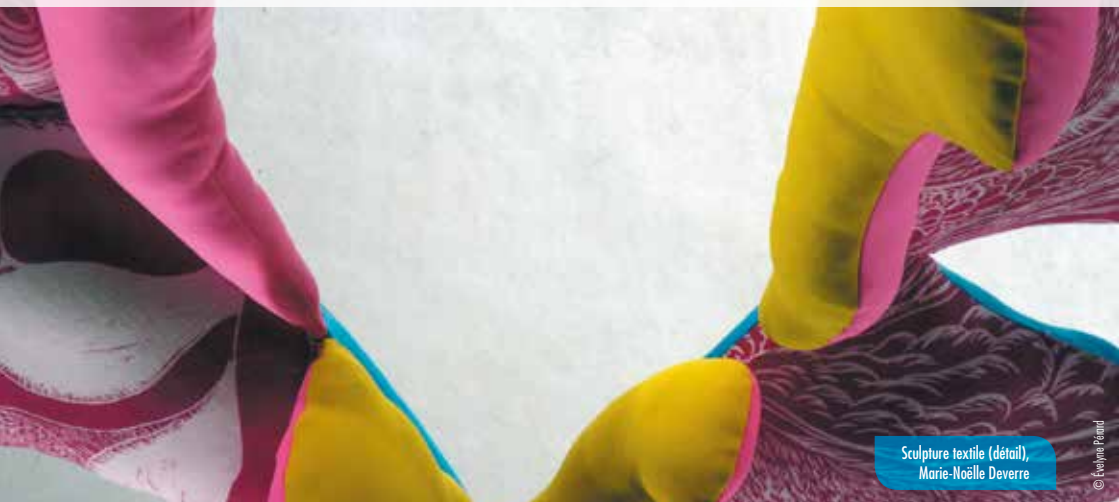
Sculpture textile (détail), Marie-Noëlle Deverre

Centre Hospitalier, Argentan • Maison des Dentelles d'Argentan • Marie-Noëlle Deverre